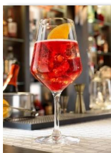
Campari Spritz 10.50