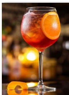
Aperol Spritz 10.50