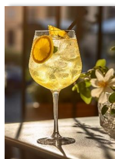
Limoncello Spritz 10.50