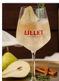
Lillet Blanc 10.50