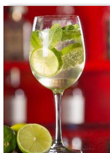
Hugo sans alcool 9.50