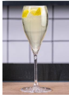
Bianco Rimuss Sans alcool