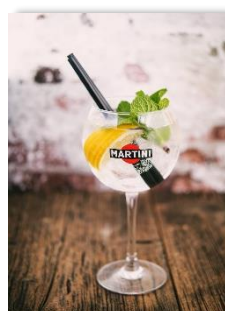
Martini Bianco sans alcool