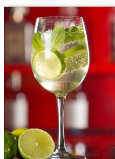
Hugo sans alcool